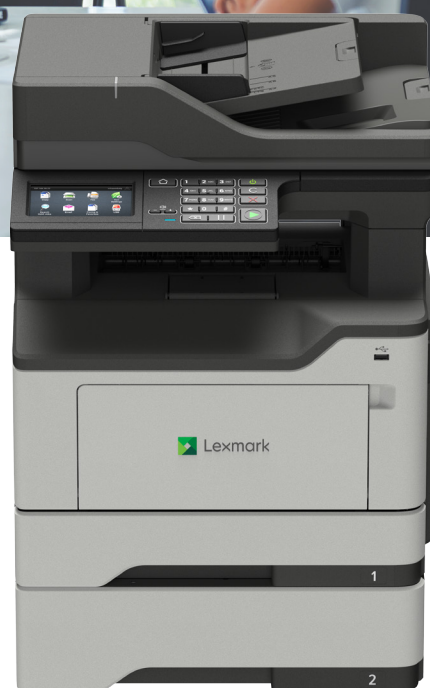
XM1242 con vassoio opzionale